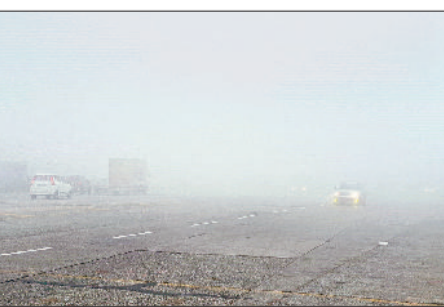
झंझर। घने कोहरे के बीच गुजरते हुए वाहन।