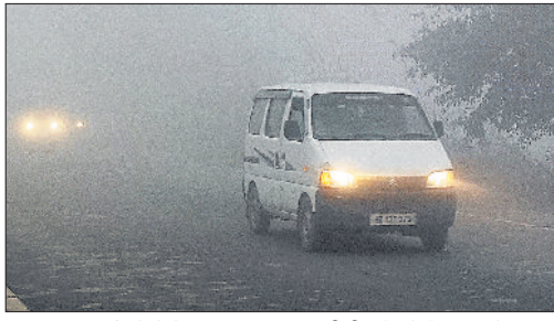
बहादुरगढ़। कोहरे में हेड लाइट जलाकर धीमी गति से निकल रहे वाहन।