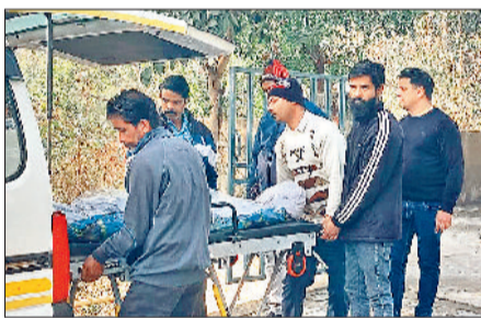
झंझर। पोस्टमार्टम के बाद शव ले जाते हुए परिजन।