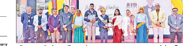
महेंद्रगढ़। बच्चों को सम्मानित करते हुए।