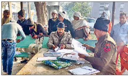
झंझर। नागरिक अस्पताल परिसर में पोस्टमार्टम के लिए कागजी कार्रवाई करते हुए पुलिसकर्मी।

बहादुरगढ़। रोहट से गुजर रही एनसीआर माइनर में एक महिला का शव मिला है। शव तीन से चार दिन पुराना बताया जा रहा है। फिलहाल शिनाख्त नहीं हो पाई है। पुलिस ने शव नागरिक अस्पताल में रखवा कर पहचान के प्रयास शुरू कर दिए हैं। घटना रविवार शाम की है। दरअसल, रोहट में एनसीआर माइनर किनारे एक शव पर किसी की नजर गई तो पुलिस को सूचना दी गई। जांच अधिकारी देवेन्द्र के अनुसार, शव तीन से चार दिन पुराना प्रतीत होता है। शरीर पर किसी तरह की चोट के निशान नहीं हैं। मृतका की उम्र करीब 50 वर्ष आंकी जा रही है। गले में ओंज का लोकेट है। पोस्टमार्टम रिपोर्ट से मौत के असल कारणों की पुष्टि हो सकेगी। शव को 72 घंटे के लिए अस्पताल में रखवा कर पहचान के प्रयास शुरू कर दिए हैं। तमाम चौकी, थानों से गुमशुदा महिलाओं की जानकारी ली जा रही है। आसपास लगते गांवों में भी सूचना जारी कर दी गई है।