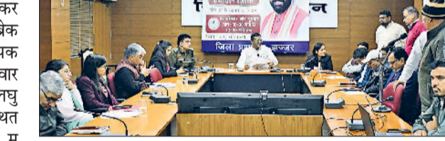
झज्जर। जिला स्तरीय समाधान शिविर में समस्याएं सुनते डीसी।