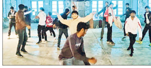
झज्जर। गीत की धुन पर डांस करते हुए स्वयंसेवक।