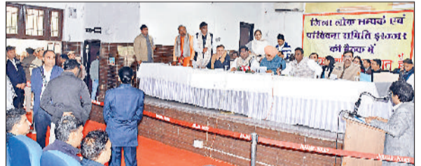
झज्जर। बैठक में जन समस्याओं की सुनवाई करते हुए कैबिनेट मंत्री श्याम सिंह राणा।

हरिभूमि न्यूज झज्जर जिला लोक संपर्क एवं परिवेदना समिति की बैठक सोमवार को लघु सचिवालय स्थित संवाद भवन में आयोजित की गई। बैठक की अध्यक्षता हरियाणा के कृषि एवं किसान कल्याण मंत्री श्याम सिंह राणा ने की। बैठक में जिले के ग्रामीण व शहरी क्षेत्रों से संबंधित कुल 17 शिकायतें सुनवाई के लिए रखी गईं, जिनमें से 15 मामलों का मौके पर ही समाधान कर दिया गया, जबकि शेष दो परिवादों को आगामी सुनवाई के लिए लंबित रखा गया। सूचीबद्ध शिकायतों के अतिरिक्त अन्य मौजूद नागरिकों की समस्याओं को भी सुना गया और अधिकारियों दिशा-निर्देश दिए गए। कैबिनेट मंत्री श्याम सिंह राणा ने कहा कि परिवेदना समिति की मासिक बैठकें शासन और नागरिकों के बीच सीधा संवाद स्थापित करने का सशक्त मंच हैं, जहां आमजन अपनी समस्याएं सीधे प्रशासन के समक्ष रख सकते हैं। परिवेदना की समस्या का समाधान करना हमारी प्राथमिकता है।