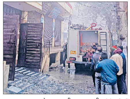
बहादुरगढ़। मकान के बाहर खड़ी दमकल गाड़ी।