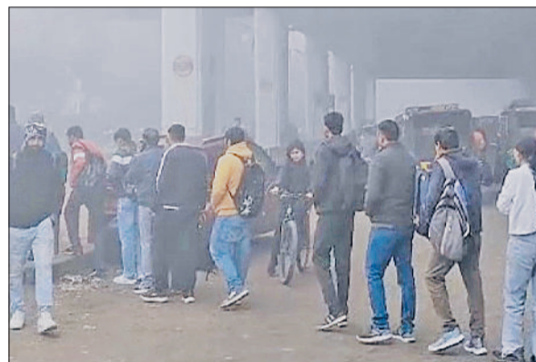
बहादुरगढ़। स्टेशन के बाहर तक लगी लोगों की लाइन।

हरिभूमि न्यूज बहादुरगढ़ सोमवार की सुबह ब्रिगेडियर होशियार सिंह मेट्रो स्टेशन यात्रियों की भारी भीड़ देखने को मिली। हालात ऐसे रहे कि स्टेशन परिसर से लेकर बाहर सड़क तक यात्रियों की लांबी कतार लग गई। दिल्ली की ओर जाने वाले यात्रियों को मेट्रो में प्रवेश करने के लिए काफी देर तक इंतजार करना पड़ा। जानकारी के अनुसार, स्टेशन पर सामान की जांच के लिए लगी बेगज इन्स्पेक्शन मशीन खराब हो गई है। मशीन खराब होने से सुरक्षा जांच की प्रक्रिया धीमी हो गई। एक ही मशीन से बैग स्कैन किए जा रहे थे। इसका सीधा असर प्रवेश द्वार पर पड़ा और देखते ही देखते भीड़ बढ़ती चली गई। यात्रियों का कहना है कि आमतौर पर सोमवार के दिन मेट्रो में सफर करने वालों की संख्या पहले से ही अधिक रहती है। ऊपर से सुबह के समय घना कोहरा छाप रहने के कारण सड़क मार्ग पर यातायात प्रभावित रहा। ऐसे में बड़ी संख्या में लोगों ने निजी वाहन छोड़कर मेट्रो से सफर करना बेहतर समझा, जिससे स्टेशन पर अतिरिक्त दबाव बन गया। यात्रियों ने बताया कि भीड़ के कारण उन्हें मेट्रो पकड़ने में देरी हुई और कुछ लोग अपने तय समय पर दफ्तर नहीं पहुंच सके।