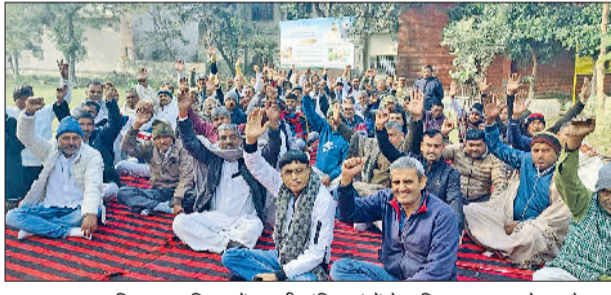
झंझर। लघु सचिवालय परिसर में अपनी लंबित मांगों के प्रति आवाज उठाते हुए पैक्स कर्मचारी।