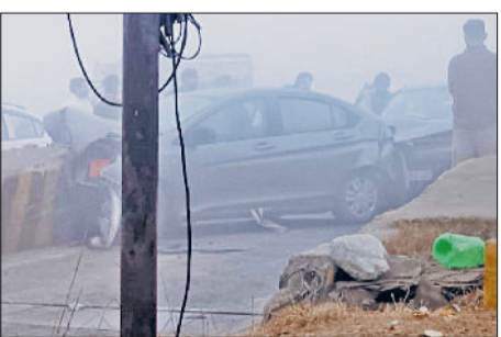
बहादुरगढ़। रोहट टोल प्लाजा के निकट भिड़ी गाड़ियां।

दरअसल, बीती देर रात को ही घना कोहरा छाने लगा था। सुबह होते ही कोहरे की सफेद चादर पूरी तरह से छा गई। कहीं कहीं दृश्यता 10 से 20 मीटर तक सिमट गई। सुबह के समय चलाने की अपील की। मौसम विभाग के अनुसार, ठंड बढ़ने के साथ आने वाले दिनों में सुबह तथा देर रात कोहरा और घना हो सकता है। वाहन चालकों को अतिरिक्त सतर्कता बरतने की जरूरत है, ताकि किसी भी तरह की दुर्घटना से बचा जा सके।