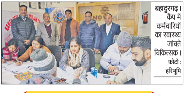
बहादुरगढ़। कैप में कर्मचारियों का स्वास्थ्य जांचते चिकित्सक।