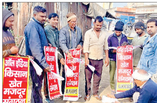
झंझर। नए अधिनियम की प्रतीकात्मक प्रतियां जलाईं हुए किसान।