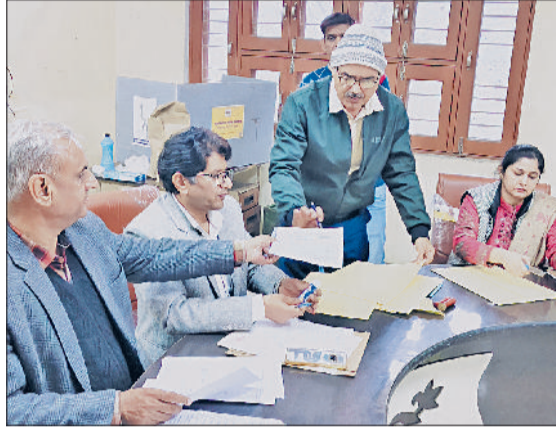
बहादुरगढ़। वोटिंग के बाद बलेट्स को सील करते एडीसी, बीडीपीओ व अन्य तथा बैठक के दौरान खंड समिति कार्यालय के गेट पर तैनात पुलिस।