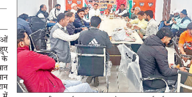
झज्जर। मन की बात कार्यक्रम का श्रवण करते हुए भाजपा कार्यकर्ता।