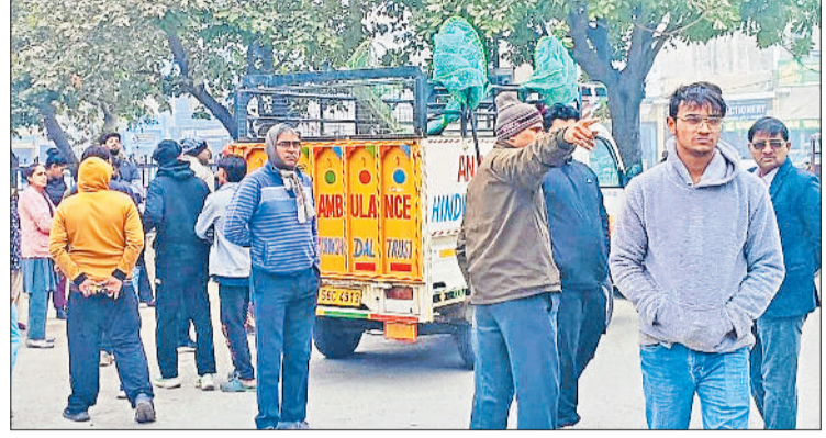
बहादुरगढ़। सेक्टर 6 में थाने के पास खड़ी एजेसी की गाड़ी।

जीव प्रेमी एबीसी के निर्धारित नियमों के आधार पर ही नसबंदी करने व पशुओं को पकड़ने की बात पर अडिग हरिभूमि न्यूज बहादुरगढ़