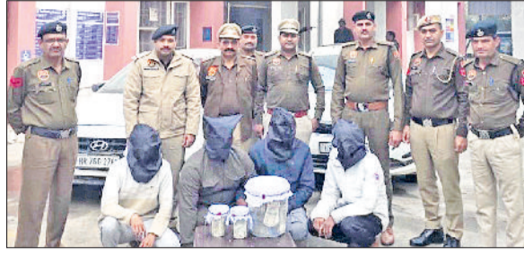
बहादुरगढ़। पुलिस की गिरफ्त में आरोपी व बरामद किए गए रुपये।

11 अप्रैल को निर्धारित बैठकें स्थगित हो गई थीं। सबकी नजरें सोमवार को होने वाली तीसरी बैठक पर टिकी थीं।